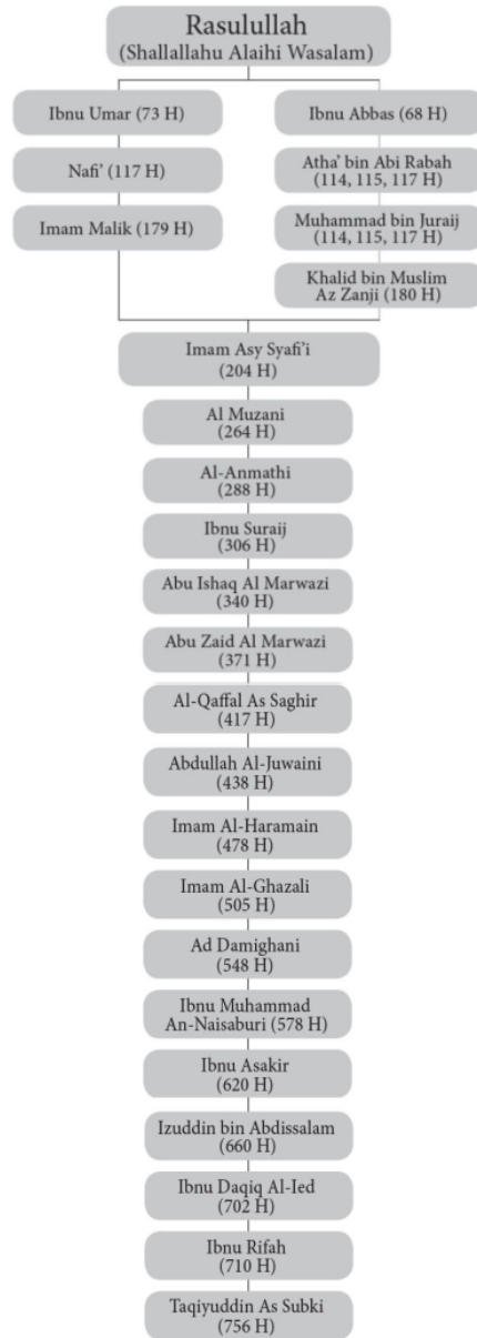
Tabel 1. Sanad Kiai Sholeh Darat Melalui Jalur Syeikh Ahmad Zaini Dahlan