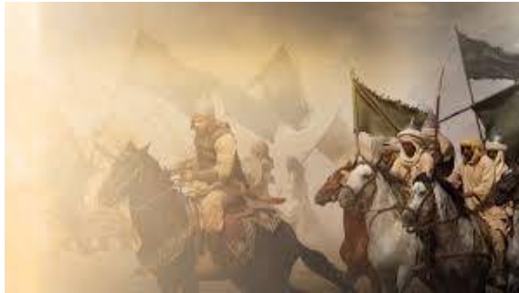
(المنظر الثاني : الشابان في مجلس الخليفة)