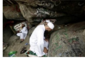
Nampak Gua bagian dalam 43

16 Secara arkeologi, Gua Hira' disebut sebagai situs arkeologi dan masuk dalam kategori Ekofak, yaitu sesuatu yang bersifat alamiah dan memiliki arti tersendiri dalam kehidupan manusia. Bila dilihat dari gambar Gua tersebut termasuk Gua yang kecil, ukuran bagian dalam Gua sekitar 1,5 x 2,5 meter dengan tinggi sekitar 2 meter. Tempat ini adalah tempat yang memiliki kedudukan spesial bagi setiap umat Islam, karena disana bermula turunnya wahyu yang kemudian berangsur-angsur menjadi sebuah kitab suci yang lengkap bernama Al-Qur'an. Kitab ini merupakan petunjuk bagi setiap manusia yang menginginkan kebahagiaan di dunia dan akhirat.