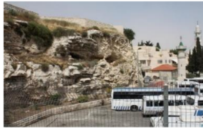
Bukit Golgota di Yerusalem. 41

disebutkan. 39 Lalu dimanakah tempat disalibnya orang yang diserupakan dengan Nabi Isa? Umat Kristiani percaya bahwa Yesus disalib di bukit Golgota (Bukit Tengkorak) di Yerusalem. Di bukit tersebut ada lokasi Yesus disalib dan makam Yesus menurut keyakinan mereka. Ada juga sebuah batu yang dipercaya sebagai tempat pengurapan jenazah orang yang diserupakan dengan Yesus, warnanya merah muda, memiliki panjang 270 cm, lebar 130 cm dan tinggi 30 cm, diletakkan hampir rata dengan tanah. 40