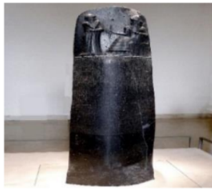
Prasasti hukum Hammurabi 29

14 Undang-undang Hammurabi adalah prasasti hukum kuno Babilonia, ia berukuran 2,25 meter dengan tulisan terukir dalam bahasa Akkadia berisi 282 peraturan mengenai berbagai ketentuan (undang-undang perdagangan, perbudakan, penuduhan, ganti rugi kerusakan, pencurian dan hubungan keluarga). Pada tahun 1901, seorang arkeolog asal Swiss, Gustave Jequier berhasil menemukan undang-undang ini di situs prasejarah Susa, Khuzestan, Iran. 27 Oleh karena itu, bisa dikategorikan undang-undang yang tertuang dalam prasasti ini adalah salah satu hukum tertua di dunia. Salah satu isi hukum tersebut berbunyi “Mata ganti mata dan gigi ganti gigi”, contoh yang lain: “Jika seseorang melakukan pencurian di sebuah rumah, maka ia harus dibunuh dan dibakar di muka rumah tempat ia melakukan pencurian”. Dengan demikian keteraturan masyarakat tercapai karena ketaatan pada hukum. 28