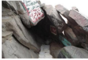
Nampak Gua Hira dari luar 42