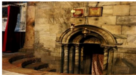
Birthplace of Jesus: Church of the Nativity and the Pilgrimage Route, Bethlehem 38

Raja Konstantin membangun Betlehem di tempat lahirnya Nabi Isa. 35 Kota Betlehem berada sekitar enam mil atau sekitar sepuluh kilo meter di sebelah selatan dari Ibu Kota Yerusalem. Saat ini tempat kelahiran Nabi Isa 36 dikenal dengan wilayah industri ash-shadafiyah dan distrik at-Tahriz yang berjarak sekitar 10 km dari sebelah selatan Yerusalem, dekat kota Elia (Baitul Maqdis). Di kota ini terdapat sebuah gereja yang dibangun atas perintah raja konstantin, di dalamnya terdapat sebuah gua yang diyakini sebagai tempat lahirnya Nabi Isa. 37 Gereja Nativity dan Rute Ziarah di Betlehem ditetapkan oleh PBB masuk dalam daftar UNESCO sebagai situs warisan dunia melalui pemungutan suara yang diadakan di Saint Petersburg, Rusia pada tahun 2012.