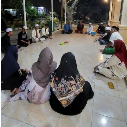
Sosialisasi Program PMQ pada Tokoh Masyarakat Setempat