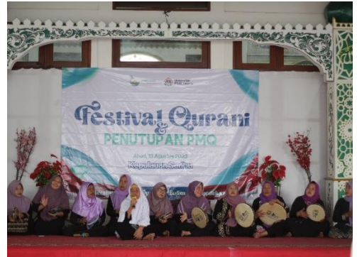
Persembahan penampilan dari masyarakat