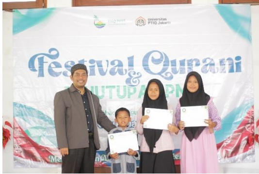
Penyerahan hadiah kepada juara lomba Festival Qur'ani