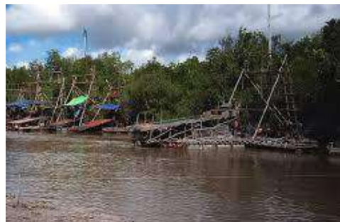
Tambang timah ilegal di Sungai Manggar Belitung Timur