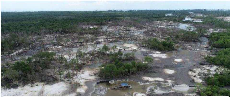
Akibat tambang timah ilegal kerusakan hutan lindung di Desa Sukamandi, Kecamatan Damar, Kabupaten Belitung Timur. Foto: Khairul Anam, diambil pada 07 Februari 2025