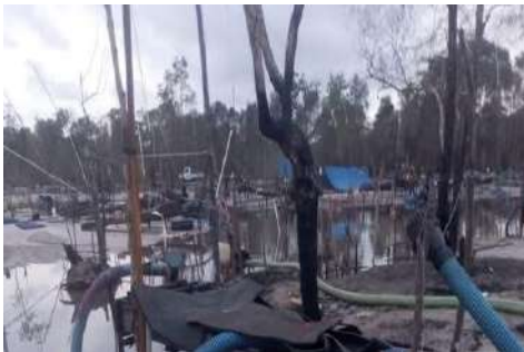
Tambang timah ilegal di Hutan Lindung Pantai Desa Juru Seberang, Foto: Khairul Anam, diambil pada 07 Februari 2025