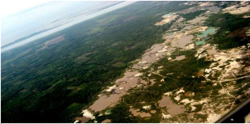
Kondisi sebagian bentang alam Pulau Belitung dari udara yang rusak akibat tambang timah ilegal Foto: Khairul Anam, diambil pada 23/12/2024