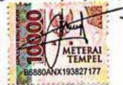
Inacio Antonio Soares

Jakarta, 03 September 2025 Yang membuat pernyataan,