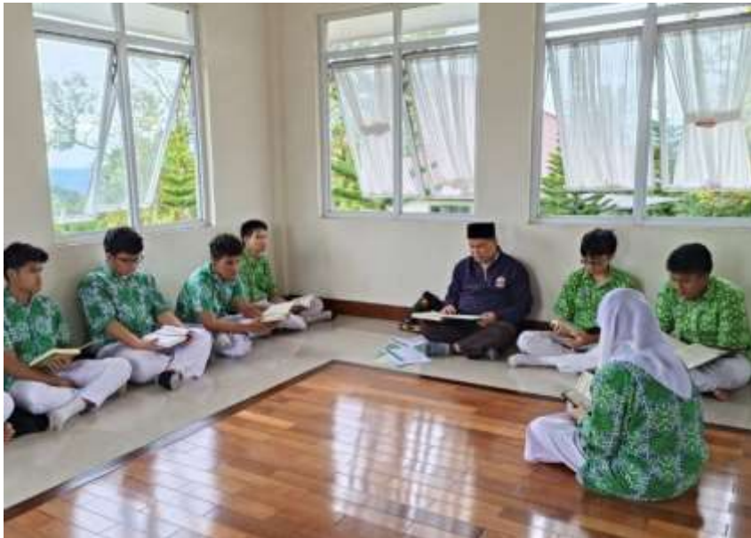
Foto 6 Pembelajaran Tahfiz