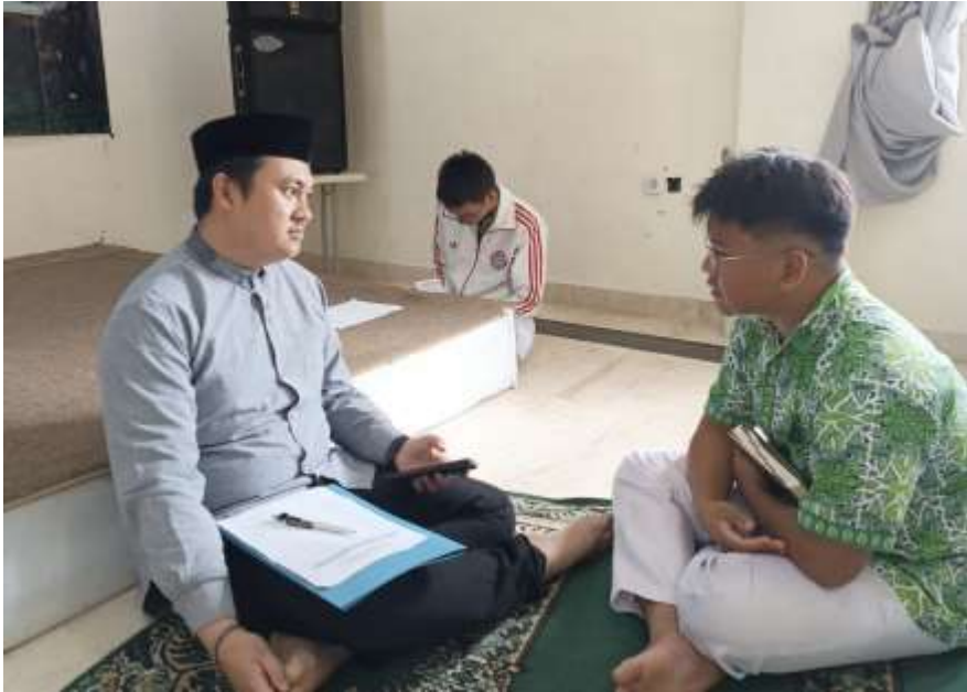
Foto 9 Pembelajaran Tahfiz