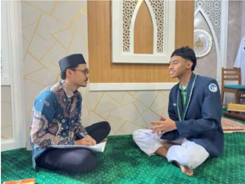
Foto 15 Wawancara Murid