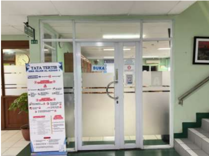
Foto 1 Ruang TU