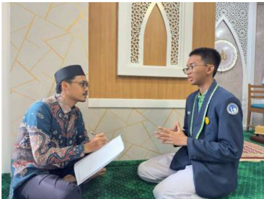
Foto 13 Wawancara Murid