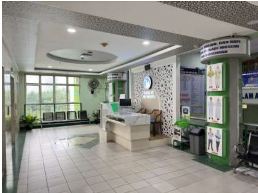
Meja Piket Sekolah