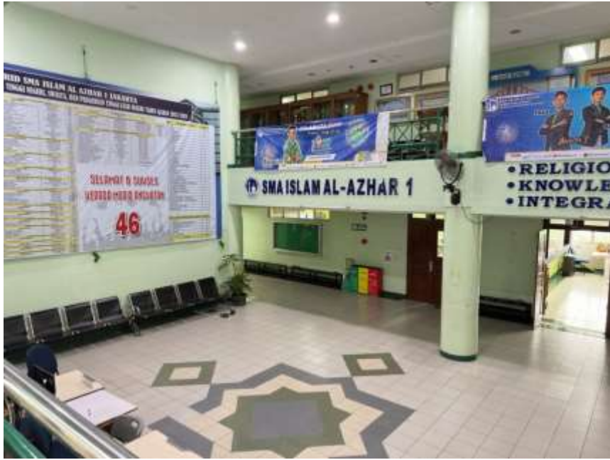
SMA Islam AL Azhar 1 Jakarta, Jl. Sisingamangaraja, Selong, Kec. Kebayoran Baru, Kota Jakarta Selatan, Prov. DKI Jakarta