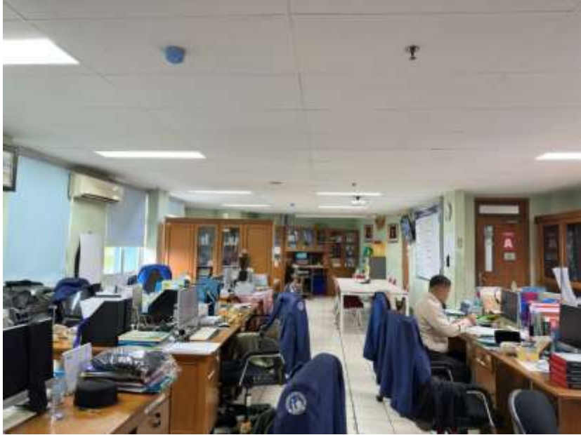
Foto 3 Ruang Guru