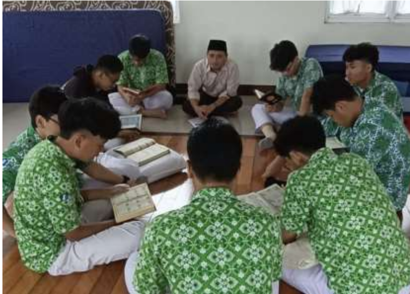
Foto 7 Pembelajaran Tahfiz