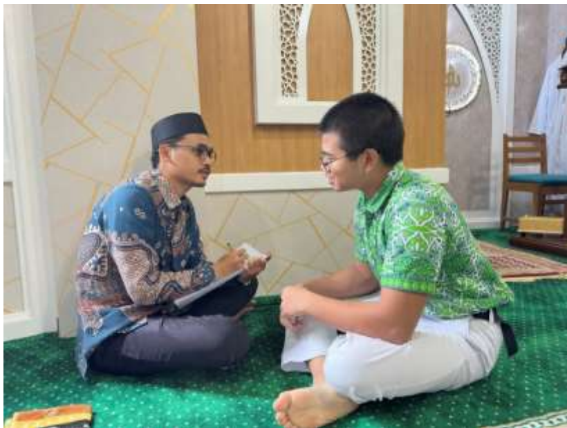
Foto 18 Wawancara Murid