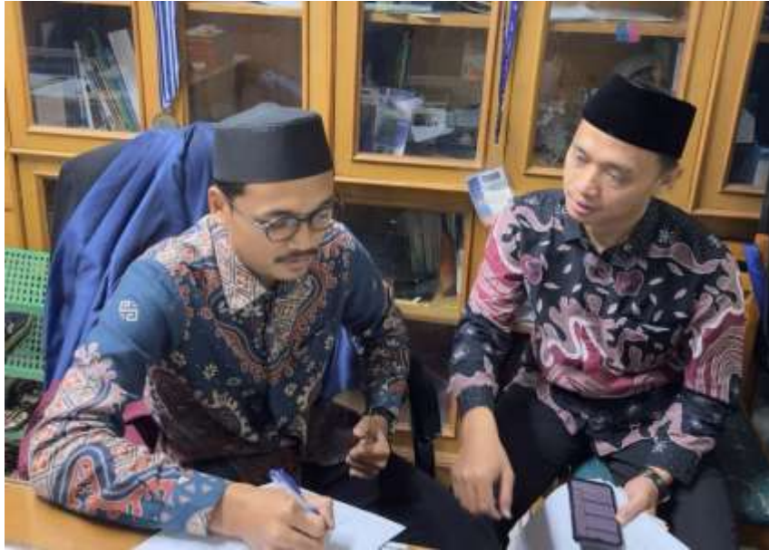
Foto 17 Wawancara dengan guru Tahfiz