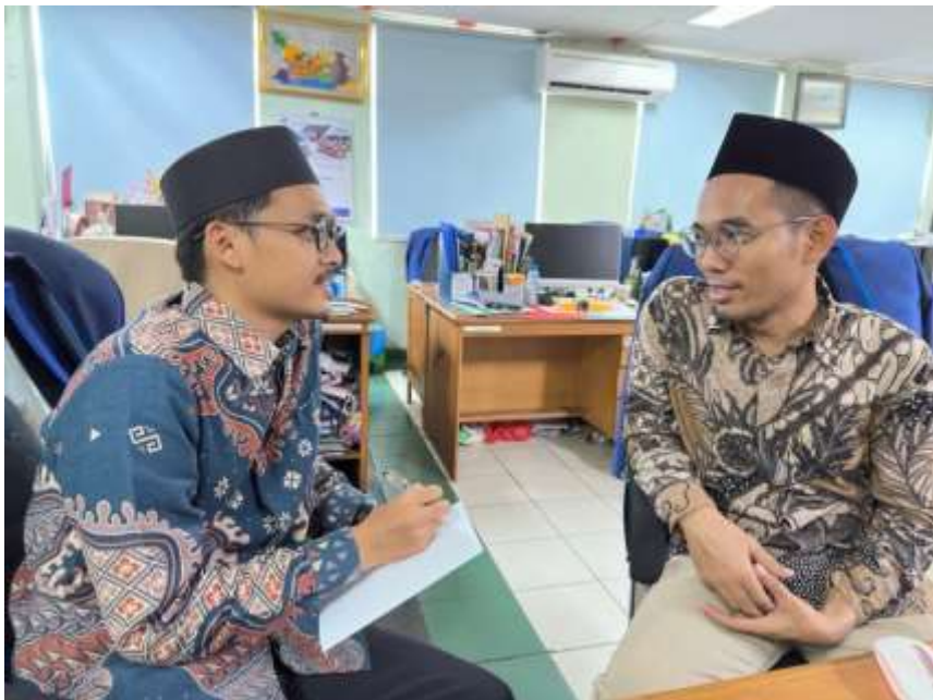
Foto 16 Wawancara dengan Wali Kelas