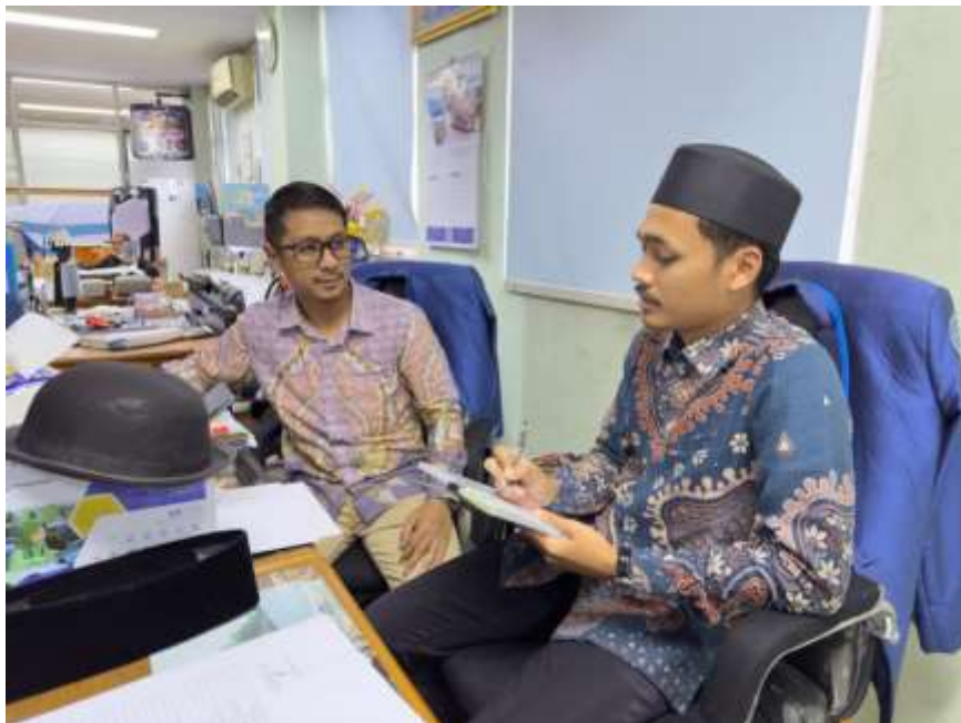
Foto 12 Wawancara dengan Koordinator bidang Kurikulum