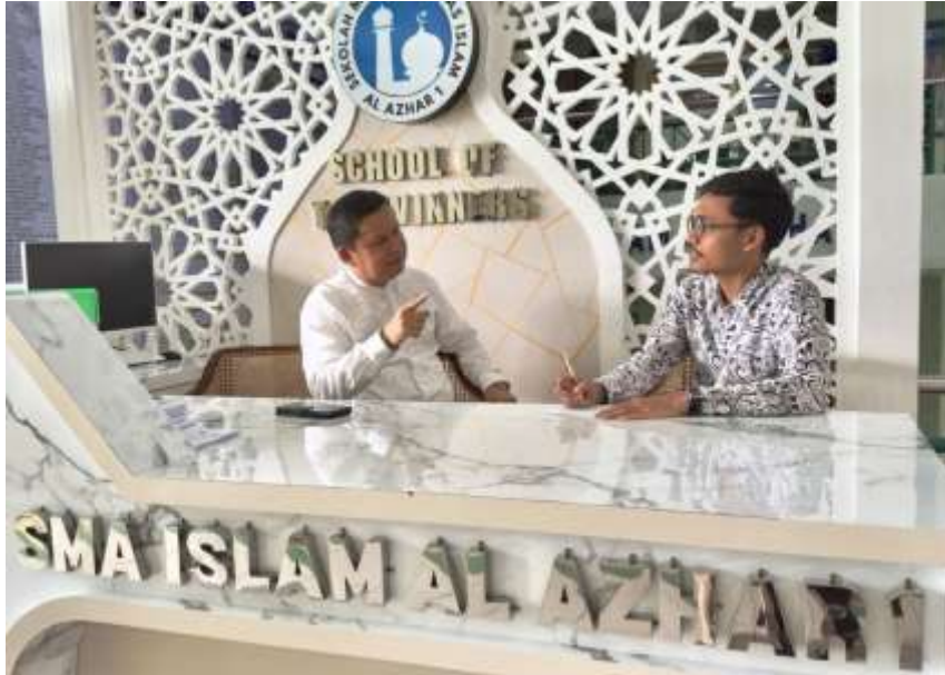
Foto 19 Wawancara dengan Koordinator bidang Agama