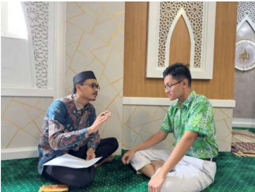
Foto 10 Wawancara Murid