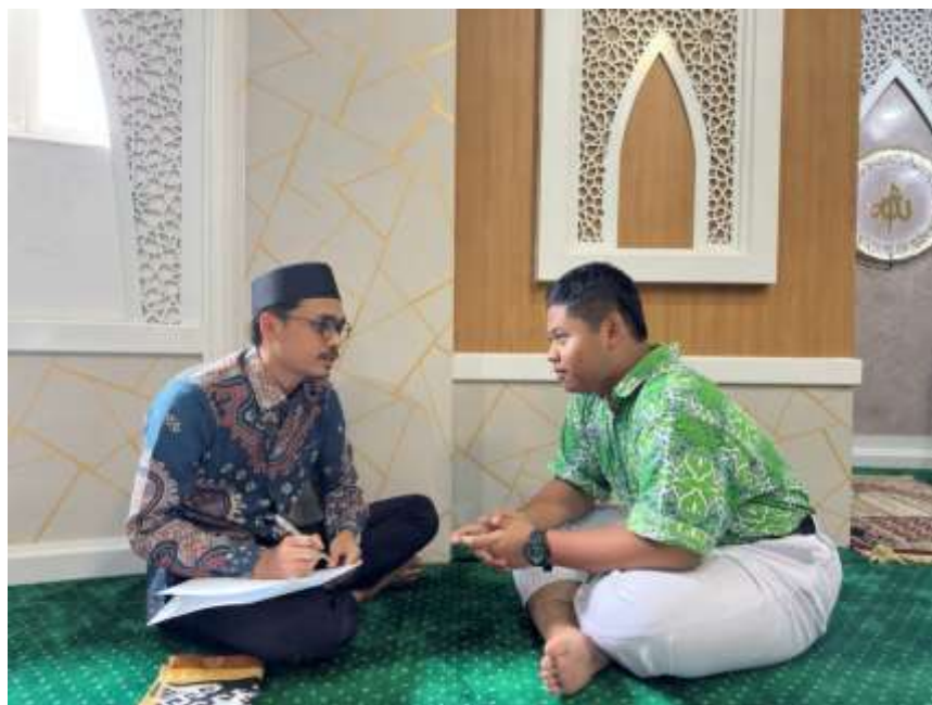
Foto 14 Wawancara Murid