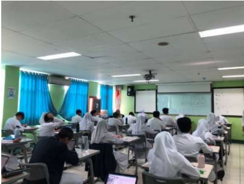
Foto 4 Ruang Kelas