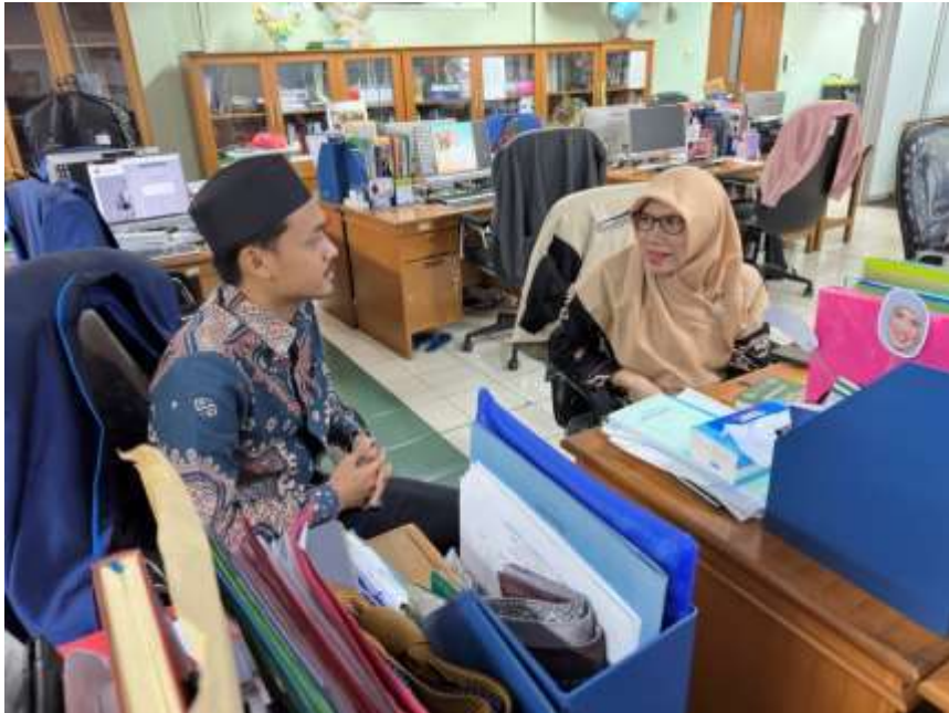
Foto 11 Wawancara dengan guru BK