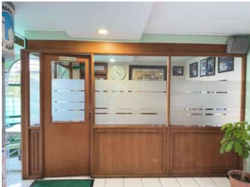
Foto 2 Ruang Kepala Sekolah